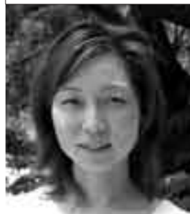
▲ステップしおさい 小田所長

しおさいを開所しました。けれども、そこは建物が古く、手狭になったため、現在の浜町にステップしおさいを開所することになったのです。