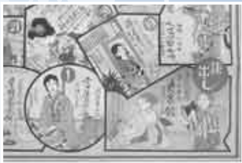
蒲郡商店街すぐろく（戦前）

優美なデザインの戦前の広告、記憶に新しい大型スーパーの開店チラシ、身近なお店の折込広告など、あの日、あのころの広告を大量に展示します。