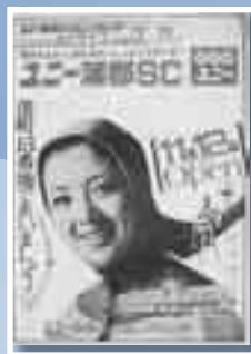
ユニー開店（昭和46年）

優美なデザインの戦前の広告、記憶に新しい大型スーパーの開店チラシ、身近なお店の折込広告など、あの日、あのころの広告を大量に展示します。