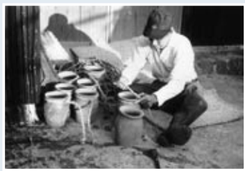
タコツボ漁の準備(昭和47年)