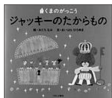
「ジャッキーのたからもの」 あだちなみ／絵 あいほろゆき／文 プロンズ新社

おてんばジャッキーのいたずらに、おにいちゃんたちはかーんかん。おこられたジャッキーは家出してしまいます。でも、何にもすることがないので、池のほとりでひと休み。宿題の作文「わたしのたからもの」のことを考えると…。