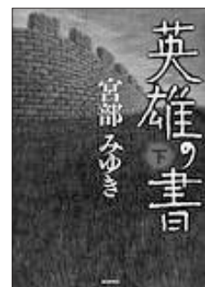
「英雄の書」 宮部みゆき／著 毎日新聞社

そこは禁忌の地。「あれ」が獄を破った。戦いが始まる…。「英雄」に取りつかれた兄を救うため、友理子は物語の世界へと旅立った。ふたりの幼子と、ひとりの僧侶と、ひとりの魂なき流浪者の織りなす、忌まわしき命の物語。上下巻