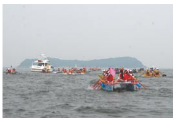
第10回三河大島いかだレース大会

三河湾に浮かぶ無人島「三河大島」をめぐり、市内3カ所から一斉に舟を漕ぎ出し、島の利権を競いあった『しまとり話』。蒲郡に古くから伝わる伝説です。