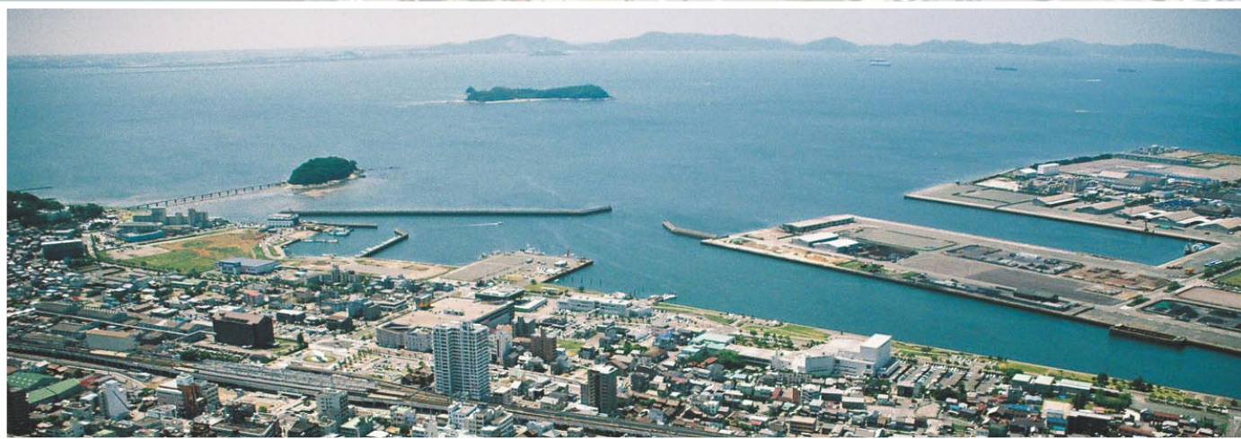
▲蒲郡と三河湾を上空から撮影。水平線が湾曲しており、海的美しさとともに、地球が球状であることを実感させられる。