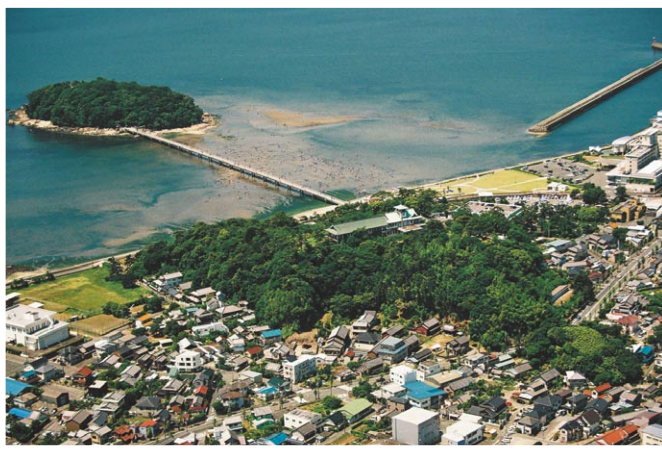
▲竹島を上空から撮影。緑青のコントラストが印象的。