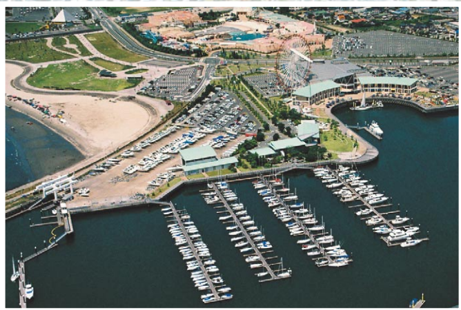
▲▼ラグーナ周辺を撮影。一大リゾート地を上空から捉えた写真は異国の地を想像させる。