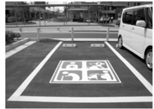
蒲郡北駅前公共駐車場