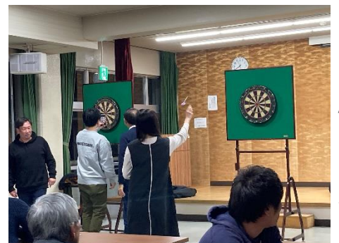
《ダーツを楽しむ皆さん》