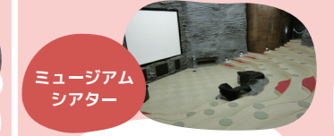
ミュージアムシアター

地球の歴史や現在の地球のようすを楽しく学習できるシアターを上映しています ※定期的な上映プログラムが替わります