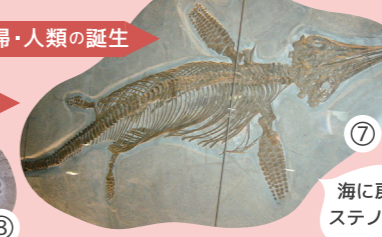
⑦ 海に戻ったハ虫類 ステノプテリギウス