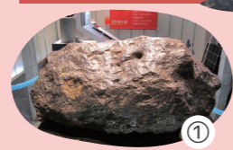
① 宇宙からやってきた巨大ないん石 さわっておいをかいでみると...