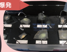
④ 最古の脊椎動物 ハイコウイクチス