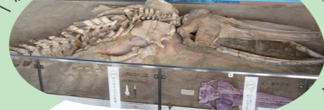
⑨ インカクジラの化石 新属新種！世界にひとつしかない ホロタイプ標本に指定されました