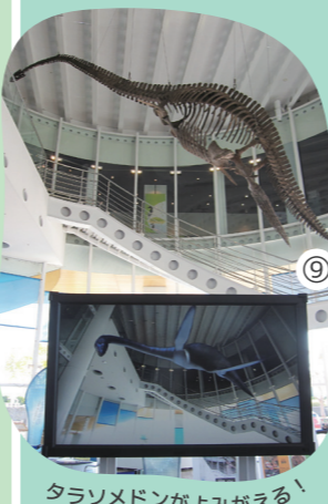
タラソメドンがよみがえる！