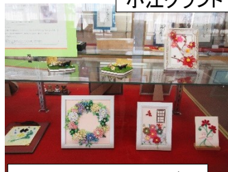
わふくる(クイリング)