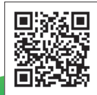
家族葬の結家(ゆいか)