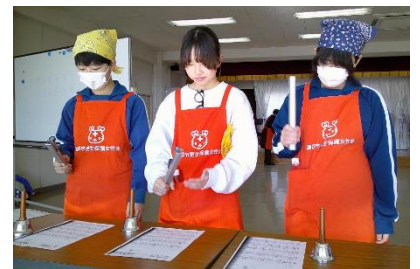
「トーンチャイムの演奏を披露」