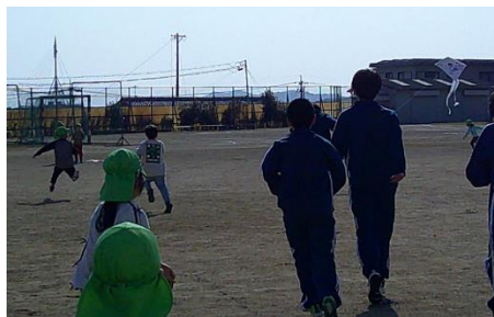
「塩津保育園児の凧揚げ」