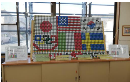
「塩中生のエコキャップアート展示」