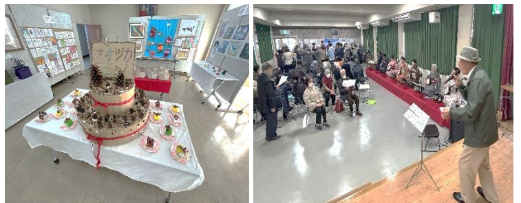
《ご来館ありがとうございました》