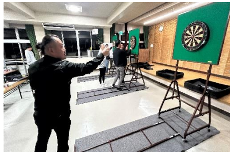
《ダーツを楽しむ皆さん》

令和6年度の体育行事は6月のソフトボール・キックベースボール大会が雨天中止でしたが、相楽の森の文化祭に合わせて開催した「みんなで歩こう健康づくり大会」に始まり、6月のバレーボール大会、9月の町民運動会、11月のニュースポーツ大会（スポーツ鬼ごっこ）までの行事が盛大に実施できました。