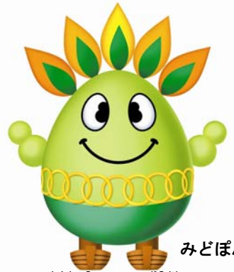
みどぼん 身長220cm、胴回り330cm みんなの笑顔が大好き！

愛知こどもの国は、100万㎡もの広大な自然のなかで、ゆったりとした自然の癒しと、こども自動車などの楽しい乗り物などを楽しむことのできる、こどもたちとご家族のオアシスです。 そんなこどもの国へ、電車にのり、軽い散策を楽しみながら訪れる企画をご用意しました。 名鉄こどもの国駅前では、電車到着時刻にあわせて、こどもたちの人気者みどぼんとのふれあいイベントを行います。 ご家族いっしょに是非ご参加ください（参加申込みは不要です。）