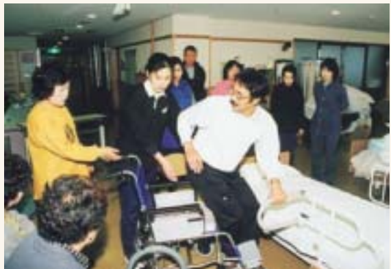
ふれあい介護教室

ケアハウス ...日常生活のほとんどは自分でできるが、自宅での生活に不安のある高齢者を対象にした民間の入居施設。食事、生活相談、健康診断、緊急対応など各種サービスを提供する。