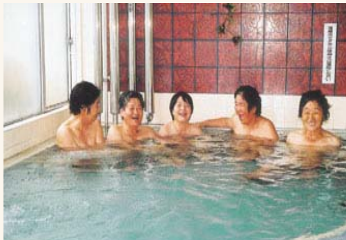
寿楽荘「ふれあい入浴サービス」