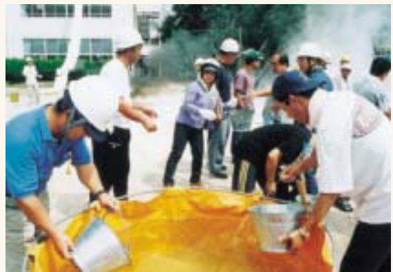
市民総ぐるみ防災訓練

特に本市は、市域が長い海岸線と三方を山で囲まれているため、台風による高潮、豪雨時等における水害や山地の崩壊、竜巻など、天災による被害は計り知ることができません。 近い将来、東海沖での大地震発生が心配されている中で、市民の生命・身体及び財産を守るため、大規模地震への対応をはじめ、防災体制の一層の強化が必要となります。