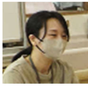
【講師：こども家庭センター 彦坂保健師】

元気がない、表情が乏しい、ゴロゴロしている。顔色が悪い、目が潤んでいるなど、普段との違いを少しでも早く気がついて対応することが大切です。