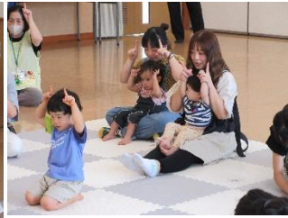
<親子でふれあいあそび>