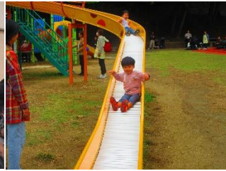
<赤塚山公園 バス遠足>