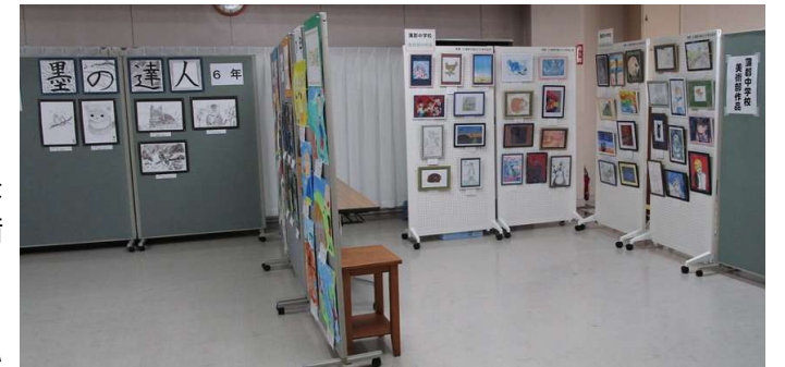
蒲郡東部小(左)と蒲中(右)の作品