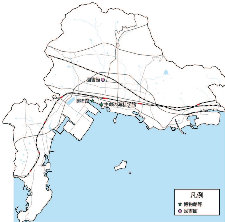
図 3-23 配置状況・外観写真（生涯学習施設）