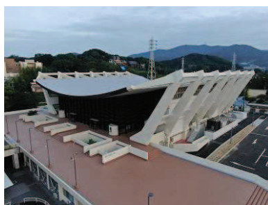
市民体育センター