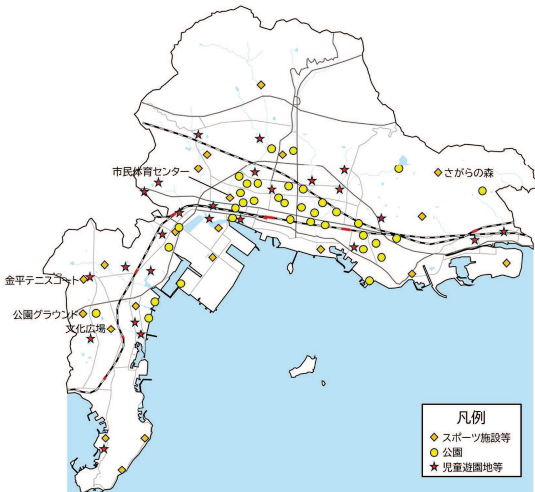
図 3-30 配置状況・外観写真（体育施設）