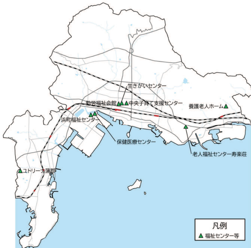
図 3-64 配置状況・外観写真（保健・福祉施設）