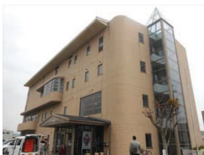
生きがいセンター