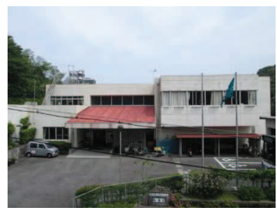
老人福祉センター寿楽荘