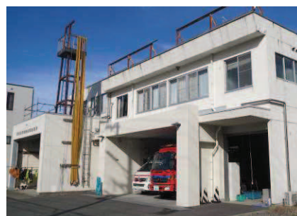
消防署東部出張所