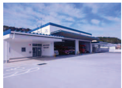
消防署西部出張所