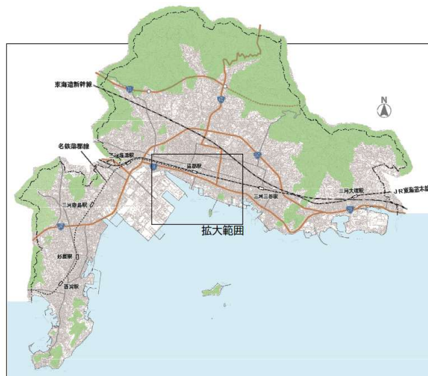
図 市域と対象地域の位置