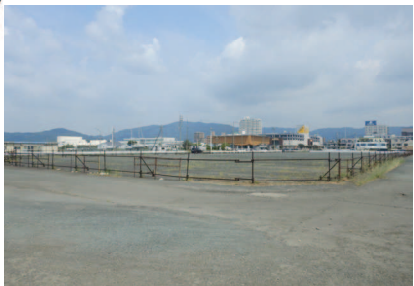
R8No. 1 (アスファルト)