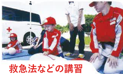
救急法などの講習

迅速に医療救護活動を展開するために日頃から近隣県支部や他機関と連携し、様々な想定の実地訓練を重ねています。