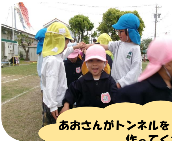
あおさんがトンネルを 作ってくれたよ!!