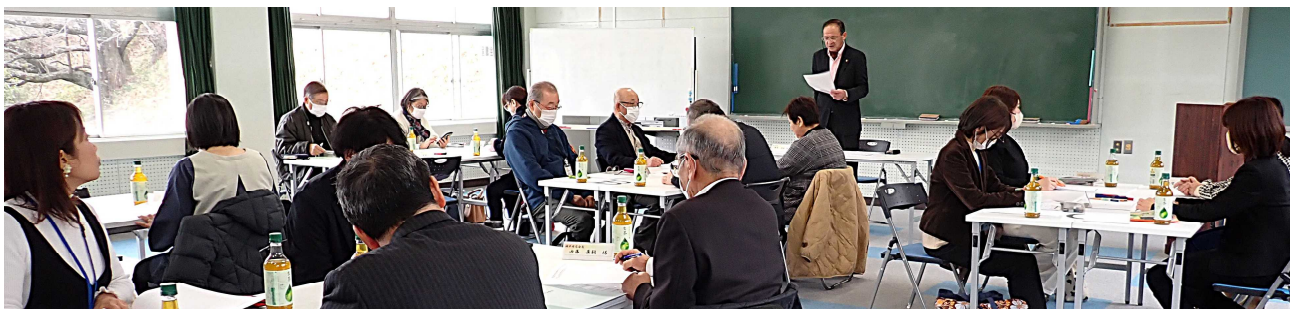
【第4回 「塩津CS」学校運営協議会】 ※塩津CS＝塩津学区小中一貫型コミュニティスクール