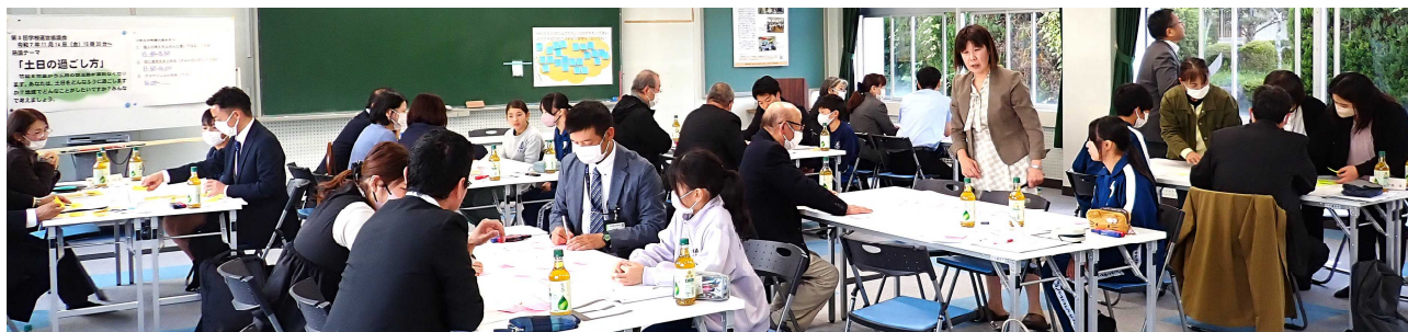
【第3回 「塩津CS」学校運営協議会】 ※塩津CS＝塩津学区小中一貫型コミュニティスクール

第3回塩津CS運営協議会が、11月14日（金）塩津中学校にて開催されました。今回も、学校運営協議会委員だけでなく、「塩津小学校児童と先生」「塩津中学校生徒と先生」「教育委員会」「市議員」の皆さんが参加しました。