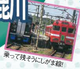
乗って残そうにしがま線!