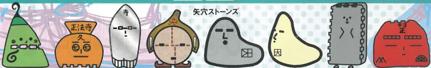
八貫山矢穴石「蔵一」 正法寺古墳矢穴石「正法寺お七」 寺部海岸矢穴石「寺5A」 沖島矢穴石「ヤアナイト1215」 前鳥矢穴石「やあなちゃん」 やあなちゃんの妹「やあなのちゃん」 黒岩矢穴石「黒岩スミス」 八貫山矢穴石「八貫清正」