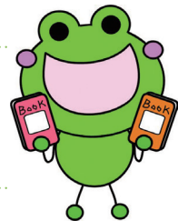
図書館キャラクター めくるくん