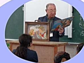
金沢文庫さん いろいろな方が毎回来てくださっています! この日は紙芝居『コロンプス』を 読んでいただきました

木曜日の掃除の時間を利用して絵本の読み聞かせを15分間していただきます。読む本を毎回選んで練習してきてください。本当に皆さん上手なんです!子ども達も食いついて聴いています。蒲郡市内の小学校の中でも読み聞かせの回数は塩津小学校はダントツ多いですよー♡これもパートナーさんのお力添えあってできること!