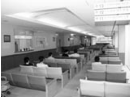
市民病院外来受付

希望時間が集中して予約時間内での診療が無理でも受けざるを得ない状況である。待ち時間の掲示等は、受付窓口で対応可能なものを一部試行しているが、今後検討する。