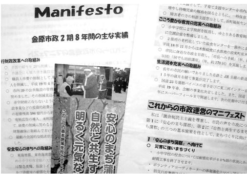
市長マニフェスト

答 個々のケースにより経費が相当かかる場合が予測され、木造住宅のような全額無料は他市の例がない。現在市としては、住宅