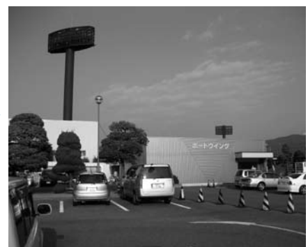
現在のボートウイング

競艇場外向発売所(ボートウイング)が、(財)競艇振興センターの整備支援を受け、既存ボートウイング西側に隣接する競艇専用駐車場の一角に新設されます。