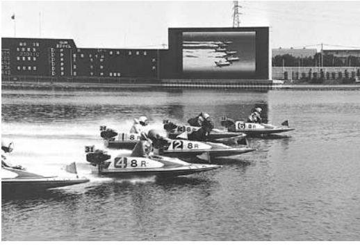
モーターボートレース

答 新しいボートピアの開設や新規ファンの開拓により、今後数年間は21年度収益と同程度の確保はでき