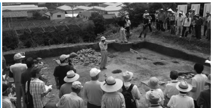
上ノ郷城跡発掘調査

答 中世の城跡としては全国的に珍しい「出入り口の石段」や「虎口」が確認され、火縄銃の弾丸、矢尻の砥石、数珠、硯等、武器や生活道具が多量に発見され、研究者の間で注目を集めている。来年度には「上ノ郷城跡発掘調査報告書」を発刊する予定である。