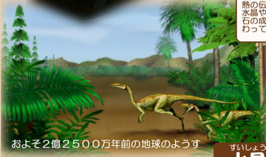
およそ2億2500万年前の地球のようす

手のひらでそっとさわってください。 ひんやりします。 熱の伝わり方で木ではないことがわかります。 水晶や石英など、鉱物の結晶がみられます。 石の成分が木にしみこみ木のなかみと入れ替 わってしまったときにできたものです。