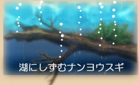
湖にしずむナンヨウスギ