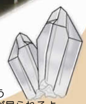
切り口をよーく見てみよう 珪化木のあちこちに水晶が見られるよ