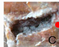
切り口の裏側にあるよ