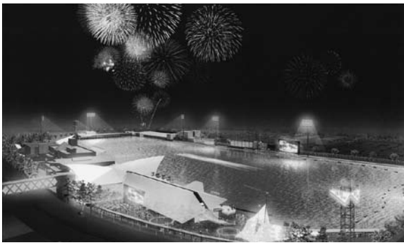
競艇施設改善イメージ図

答 当然のことながら、耐震構造にしていく。施設を新しくすることで家族連れや女性客にも気軽に来てもらえるようにし、ナイター開催場の特性を生かした施設をつくりたいと思う。