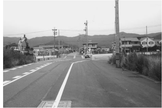
中部土地区画整理地内