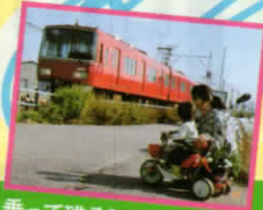
乗って残そうにしがま線!