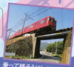
乗って残そうにしがま線!