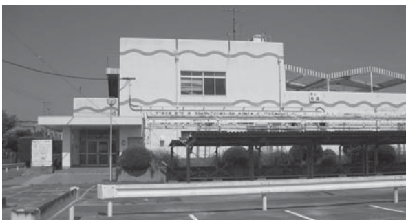
養殖装置設置予定の旧市民プール

25年度は計画書・補助金要望書の作成等を行い、26年度は実施地域住民への説明会等を行っていく。