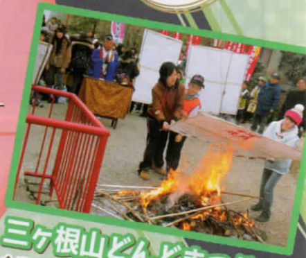
三ヶ根山どんどまつり 会場・三ヶ根観音 11:00~