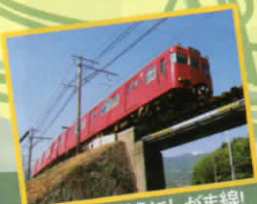
乗って残そうにしがま線!

名鉄蒲郡線 吉良吉田 三河鳥羽 西幡豆 東幡豆 こどもの国 西蒲 形原 三河鹿島 蒲郡競艇場前 蒲郡