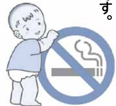
子どもの周囲は禁煙に!

市の国民健康保険特定健診受診者の喫煙率は左図のとおりで、働き盛りの男性の喫煙率が高い状況にあります。