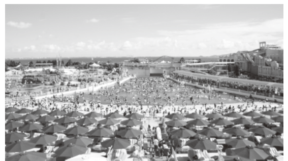
利用助成の拡大をするラグナシアのプール

答 臨時財政対策債は、標準的な市政運営をするために地方交付税の不足する部分を市で起債するものである。そのため、後年度に元利償還金相当額が地方交付税の基準財政需要額に算入されるので理論的には蒲郡市の財政運営に支障は出ないと考えている。