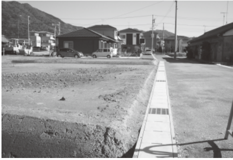
整備が進む中部土地区画整理地内

難地区がある。説明会開催 による移転のほか、仮設住 宅等への入居で一気に移転 を進める方法など検討して いきたい。また、新規で土 地を購入する場合は負担が 大きいので、仮換地変更に よる移転が可能な場合は、 土地区画整理審議会に諮っ て委員の判断を仰ぎながら 対応していきたい。