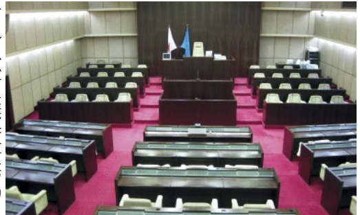
傍聴席から見た本会議場