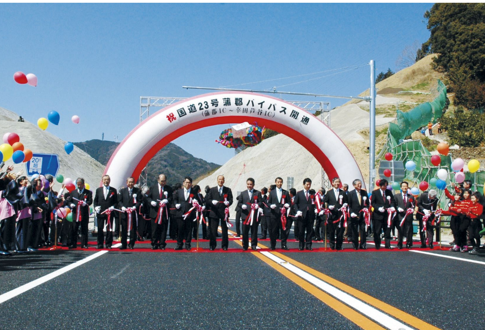
国道23号蒲郡バイパス開通！