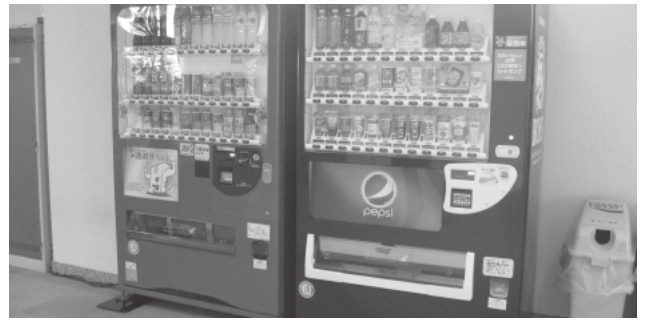
公共施設に設置されている自動販売機

市街地の良好な住環境整備のためにも市街化調整区域での1haの規制緩和による開発の推進が大切だと考えるが状況は。