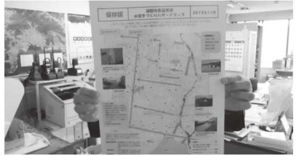
避難所の場所が記された防災マップ

答 市内で一時的に集合する避難広場が50カ所、長期に滞在する避難施設が34カ所、台風など少人数の