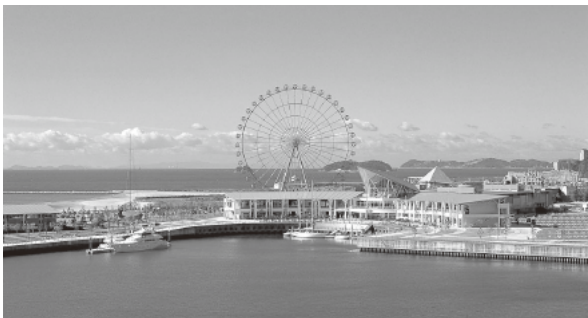
株式会社H.I.S.との検討が始まったラグーナ蒲郡

問 ラグーナ蒲郡の新しい運営事業者として株式会社エイチ・アイ・エスが挙げられている。同社のハウステンボスへの経営参加事例では、佐世保市から10年間に渡って固定資産税相当額の交付金を受ける約束や不採算部門の自治体負担等の条件を掲げている。これ以上の負担をしないという