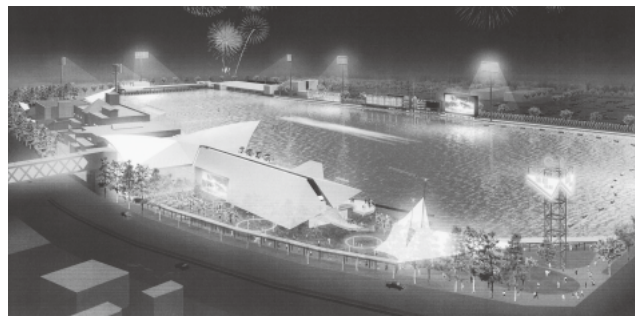
リニューアルオープンするポートルース蒲郡 (イメージ)

理大臣杯競走を初め、3場の場外発売を予定し、休催期間を最小限にとどめたいと思う。