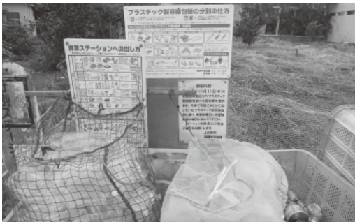
資源ごみステーション

問 ごみ有料化を含む計画 案が出されたが、市民 のほとんどは知らない。ご みを減らす取り組みを進め