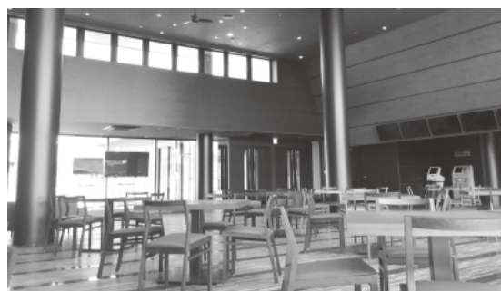
ボートレース蒲郡4階の特別ラウンジ

ンに伴い、新スタンド1階のセンターコートと4階の特別ラウンジを貸し出すことができるとしました。センターコートはステージを備えていますので、コンサート等のイベントで、特別ラウンジはパーティー等に使用できます。詳細は広報がまごおりとボートレース蒲郡のホームページで周知していきます。