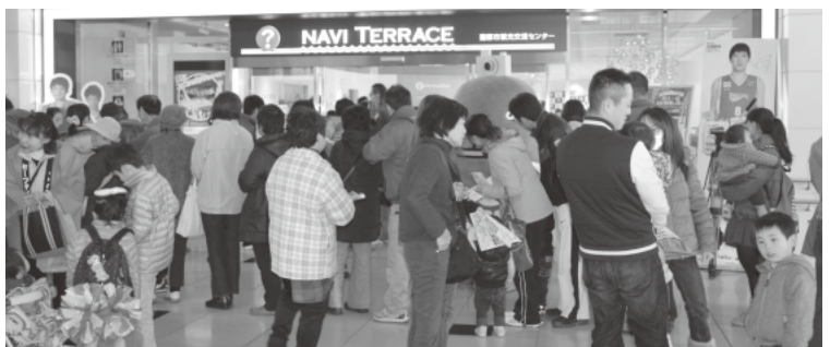
オープン1周年記念&観光交流フェアで賑わうナビテラス

問 現在は課題もあり、ナビテラスでお土産の販売ができない。QRコードやファックスを使い、その場から直接事業者注文できれば観光客等に喜ばれる。市の見解はどのようか。