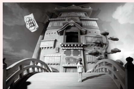
「千と千尋の神隠し」