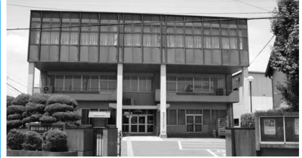
西部防災センター

答 駐車場として利用するとなると、事故防止や料金徴収など新たな設備投資も必要になる。