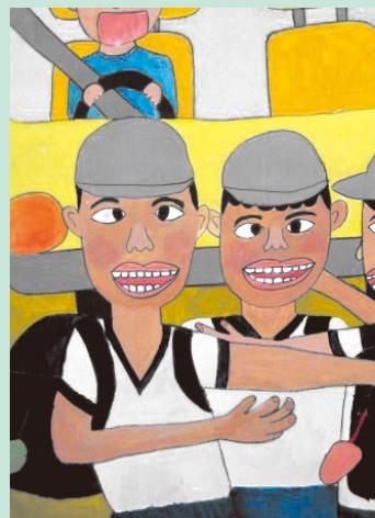
【蒲郡市教育委員会賞】