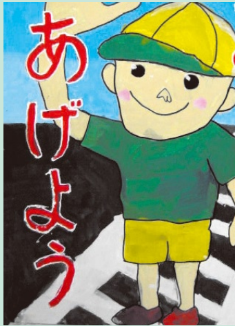
【蒲郡市交通安全都市推進協議会長（蒲郡市長）賞】