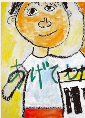
【愛知県交通安全協会蒲郡支部長賞】