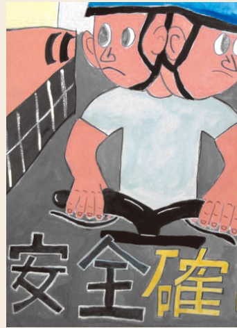
【愛知県蒲郡警察署長賞】