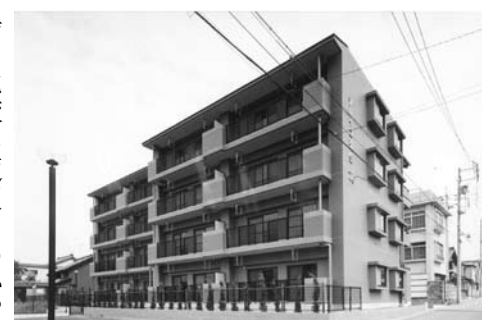
特定優良賃貸住宅のひとつソレイユ弥生

答 市内約50件の同規模物件を比較したところ、家賃相場は6万円から5万円後半であり、現在の入居状況を勘案して家賃を認定したもので、適正なものと認識しています。